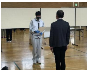
指示書を読んで開始

今回の種目は「清掃」でした。生徒は緊張の中、一生懸命取り組み、審査員からは丁寧な作業や真面目な態度を高く評価していただきました。しかし、全員が制限時間10分以内で終わることができなかつたなど課題を見つけることができました。参加者、見学者とも働くために必要な力を知る良い機会となりました。