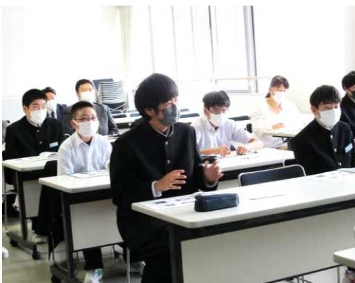
質問に答える参加者