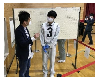
審査員と振り返りを行いました。